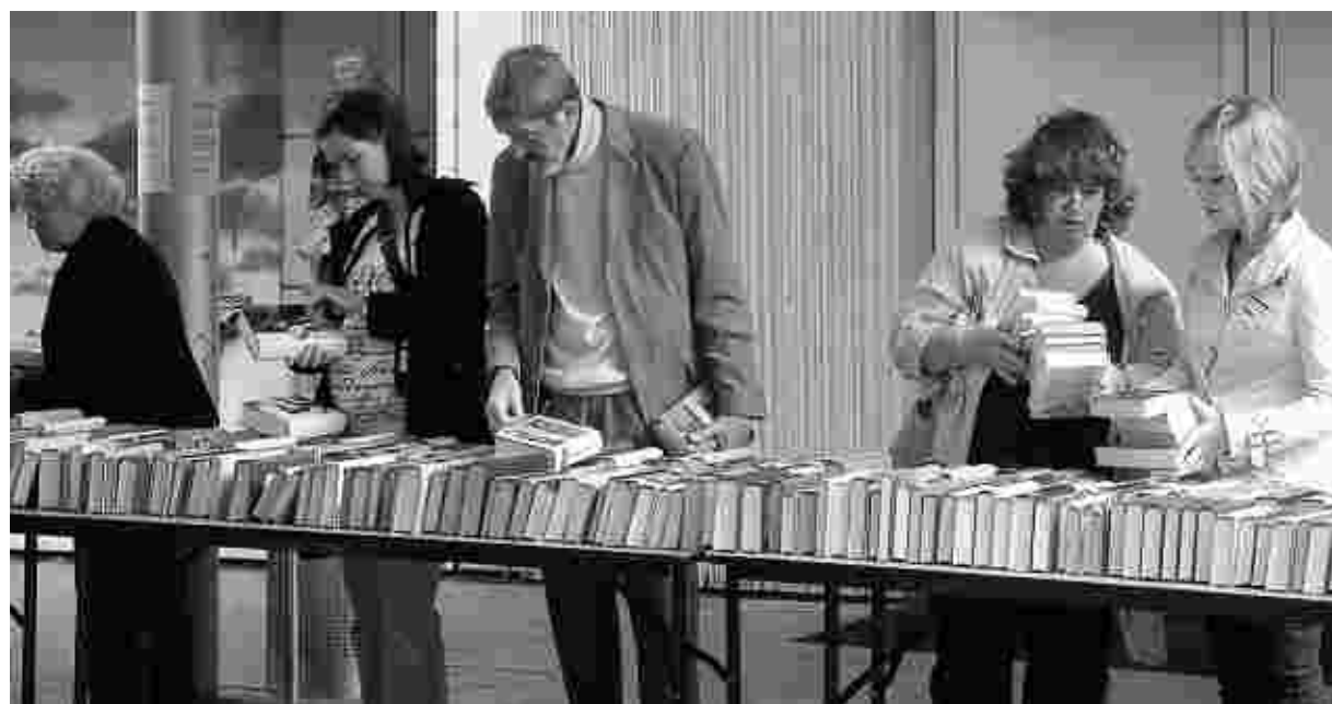
Da war für jeden etwas dabei: Der Bücherflohmarkt war auch in diesem Jahr ein voller Erfolg.